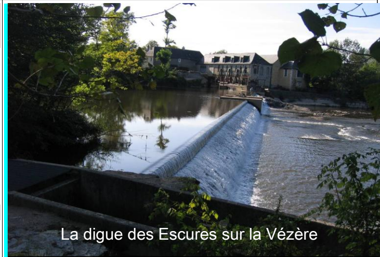
La digue des Escures sur la Vézère